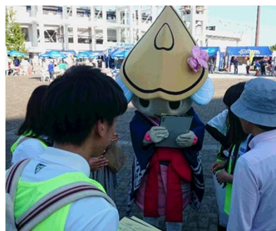
徳島ヴォルティスと協働して スタジアムでの観戦者調査

地域の住民生活における健康・体力づくり活動やスポーツ文化の消費行動などの社会問題に対して、持続可能なコミュニティを基盤にした社会環境整備のあり方を探求しています。人間の生活における運動遊びやスポーツは「身体活動をともなった人と人を結びつけるコミュニケーションの場」と捉えて、地域における住民生活—地域団体活動—企業活動—行政支援の協働による望ましいスポーツ文化の推進デザインを考案します。